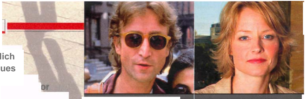
JOHN LENNON, 40+ Musiker

Einen Menschen zu verfolgen kann Terror sein, ist strafrechtlich aber schwer zu ahnden. Ein neues Gesetz soll Abhilfe schaffen