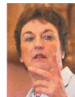
Brigitte Zypries will handeln

Zypries: Vorgesehen ist eine Freiheitsstrafe bis zu drei Jahren oder Geldstrafe.