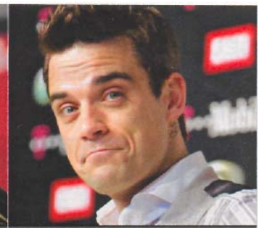
ROBBIE WILLIAMS, 31 Popsänger