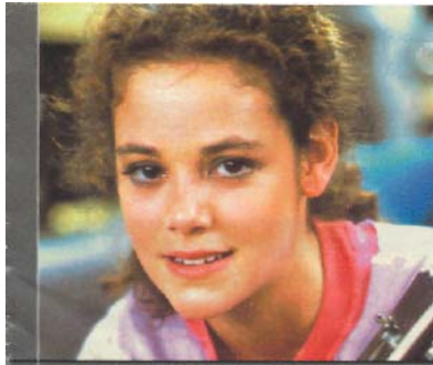
REBECCA SCHAEFER, 21† US-Serien-Star